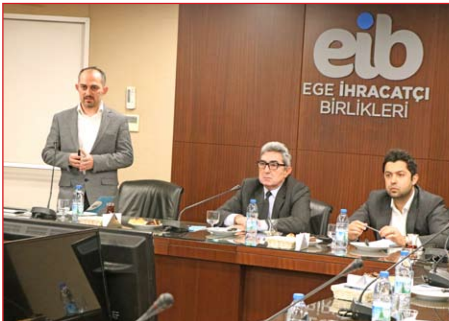
Ege İhracatçı Birlikleri'nde Matil A.Ş. bilgilendirme toplantısına Demir-Çelik sektörünün önde gelen firmalarının temsilcileri katıldı.

Ege Demir ve Demirdışı Metaller İhracatçıları Birliği ile MATİL Malzeme Test ve İnovasyon Laboratuvarları A.Ş. (MATİL A.Ş.) arasında imzalanan işbirliği protokolüne istinaden, EDDMİB üyesi firmalar, MATİL A.Ş.'de yaptıracakları tüm test, analiz ve mikro yapı incelemelerinde güncel test fiyatları üzerinden yüzde 10 indirimli hizmet alıyor.