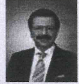
M. Rifat HİSARCIKLIÖĞLU

Gümrük ve Ticaret Bakanı Minister, Ministry of Customs and Trade