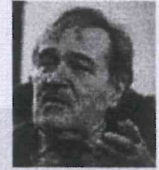
Prof. Dr. İber ORTAYLI

Yönetim Kurulu Başkanı, Alapros Chairman of the Board of Director, Alapros