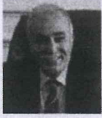
Dr. Ahmet Eşref FAKİBABA

Gıda, Tarım ve Hayvancılık Bakanı Minister, Ministry of Food, Agriculture and Livestock