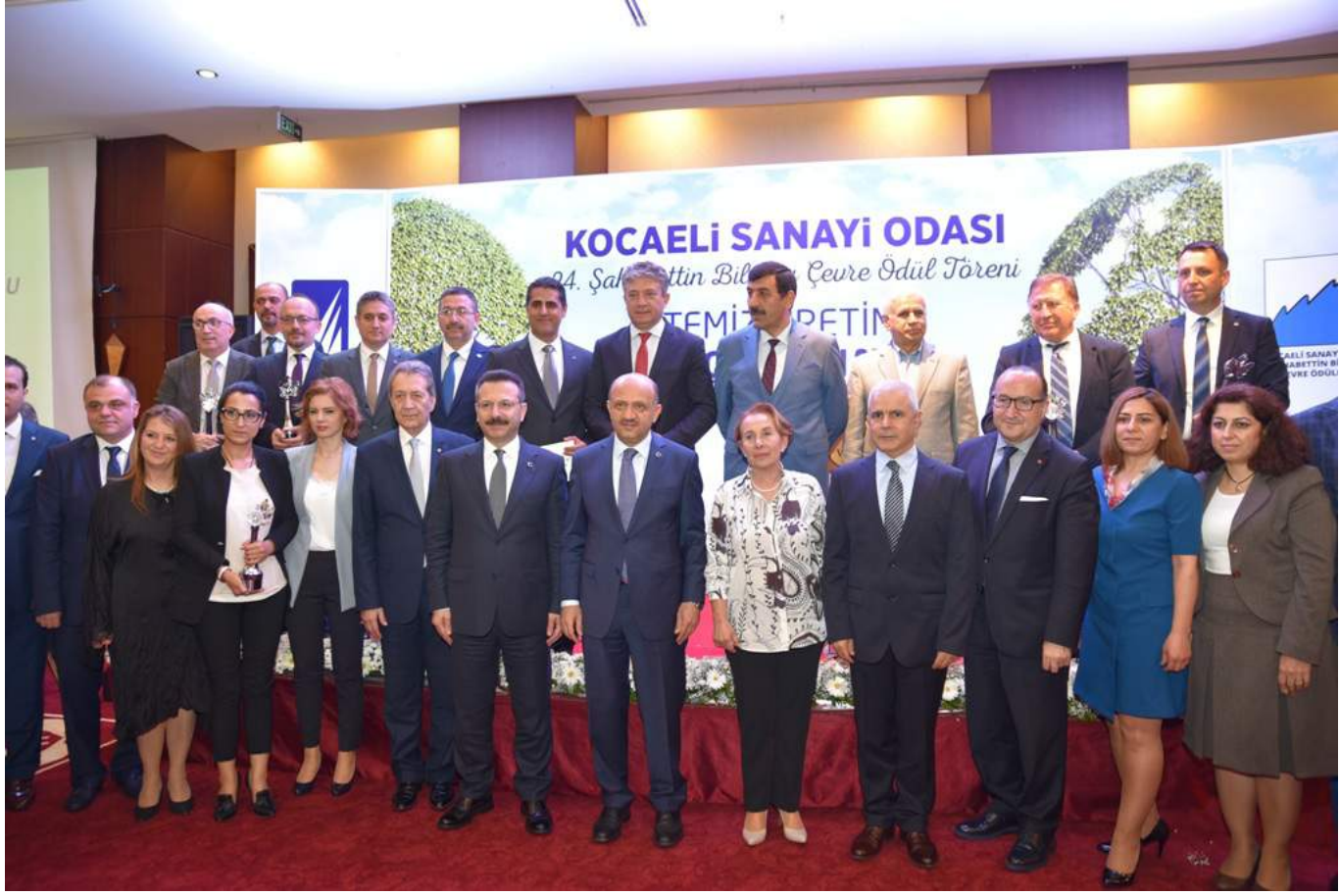
Ödül alan tüm firmalar ve ödül veren protokol mensupları birlikte fotoğraf çektirdiler