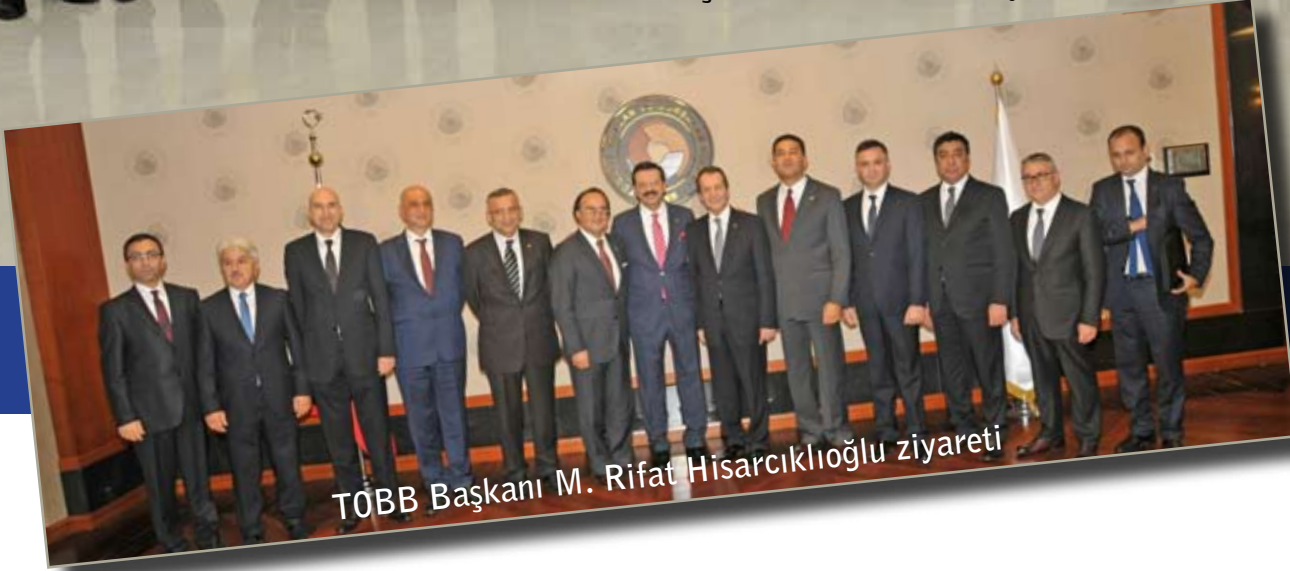
TÖBB Başkanı M. Rifat Hisarcıklıoğlu ziyareti