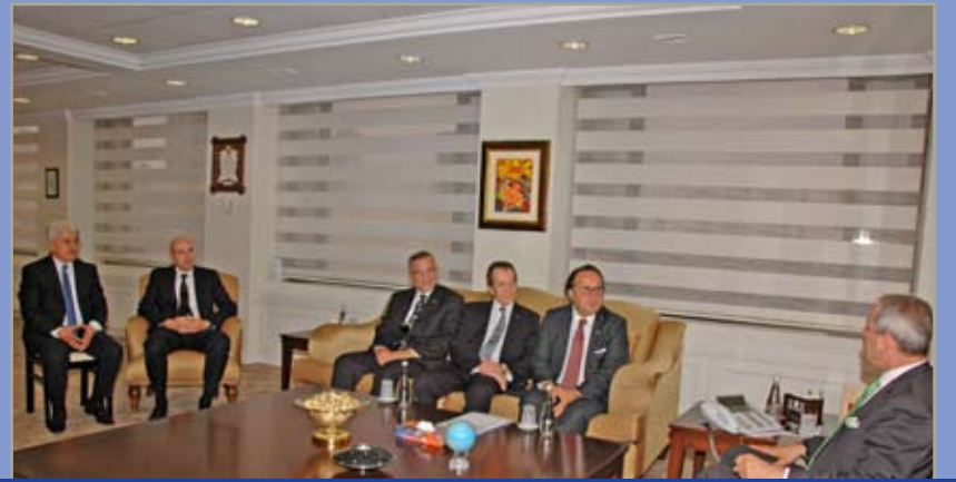
T.C. Ekonomi Bakanı Zafer Çağlayan ziyareti