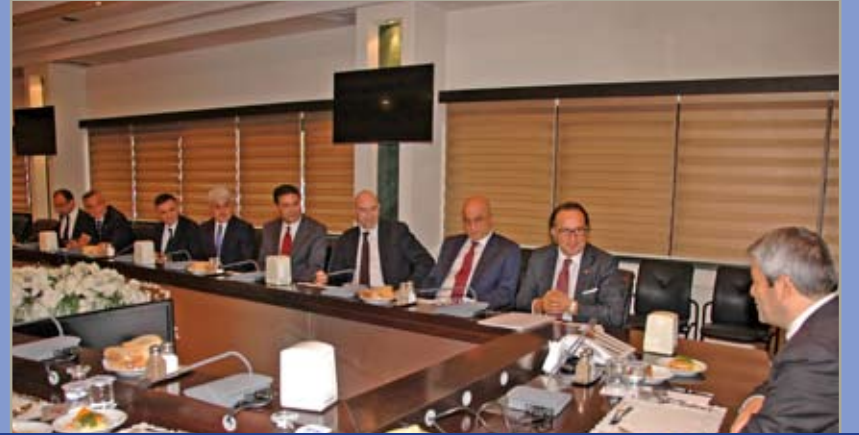
T.C. Bilim Sanayi ve Teknoloji Bakanı Nihat Ergün ziyareti