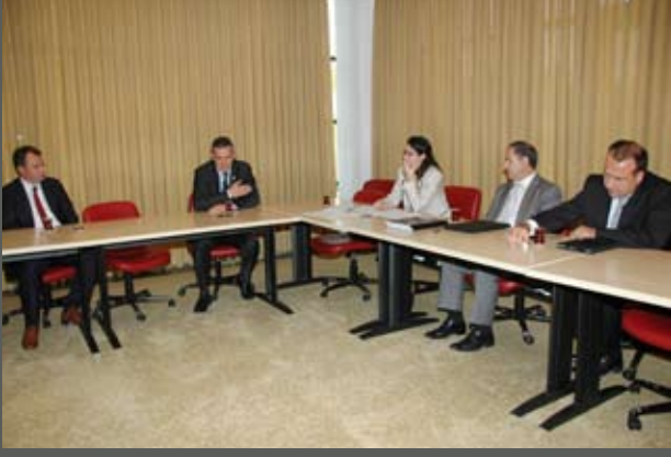
İhtisas Kom.Toplantısı 11.09.2013