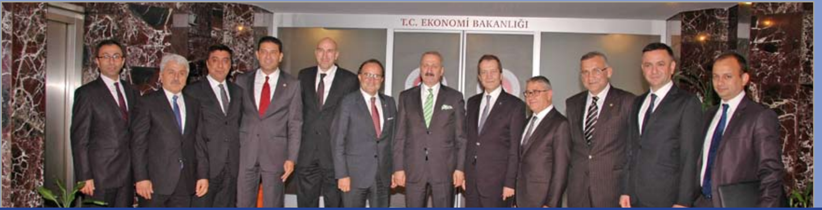
T.C. Ekonomi Bakanı Zafer Çağlayan ziyareti