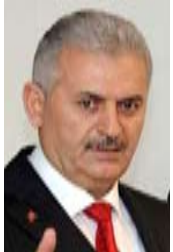
Ulaştırma ve Denizcilik Bakanı Binali Yıldırım:

YOLLAR BİZDEN, İHRACAT SİZDEN. HEDEF 300 MİLYAR DOLAR