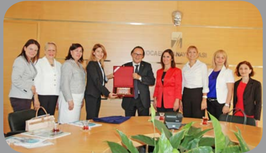
Kadın Girişimciler Kurulunun Başkana Ziyareti 13.09.2013