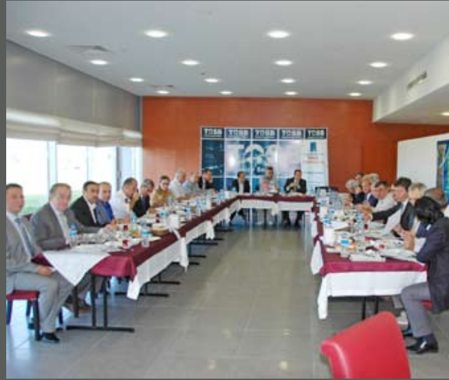
22. Meslek Komitesi TOSB'ta kahvaltılı toplantı yaptı