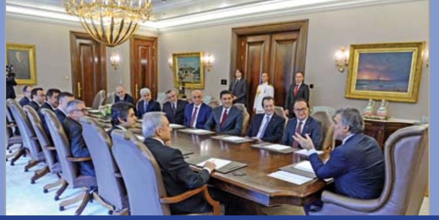
T.C. Cumhurbaşkanı Abdullah Gül ziyareti