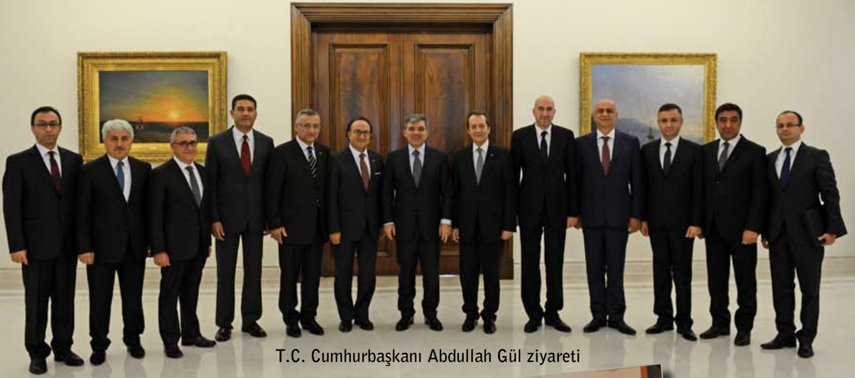
T.C. Cumhurbaşkanı Abdullah Gül ziyareti