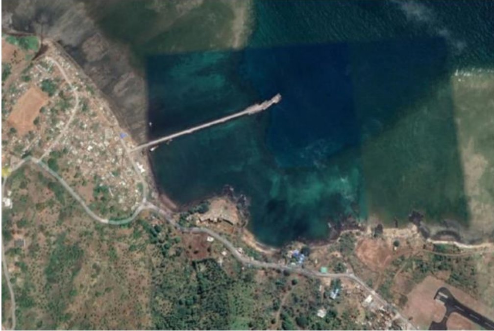
Port de BOINGOMA

La description des infrastructures existantes sera donnée plus précisément dans le Dossier d’Appel d’Offres. Il est proposé aux candidats de réaliser une visite de site dès cette phase de Sélection Initiale, afin que les candidats puissent voir l’état actuel des ouvrages existants et poser les questions nécessaires lors de cette visite de site.