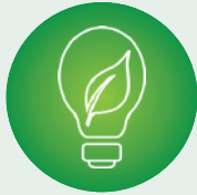
Sıfır Karbonlu Elektrik